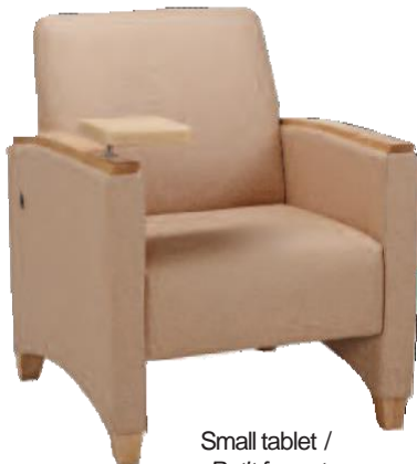
Small tablet / Petit format

The tablet can be removed and stored into the side of the chair L'accouoir tablette peut être retiré et rangé dans le côté de la chaise