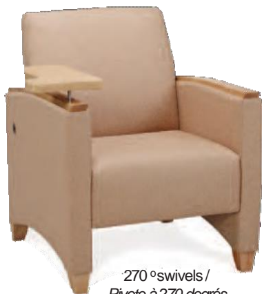
270°swivels/ Pivote à 270 degrés