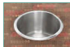
Cupholder / Porte-gobelet