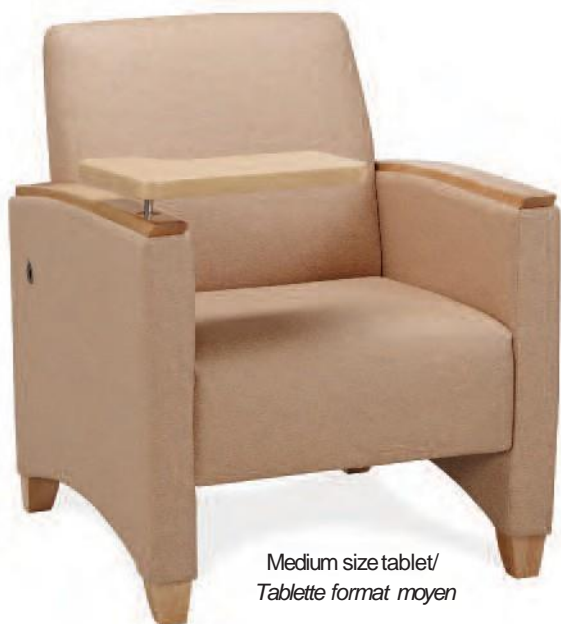
Medium size tablet/ Tablette format moyen