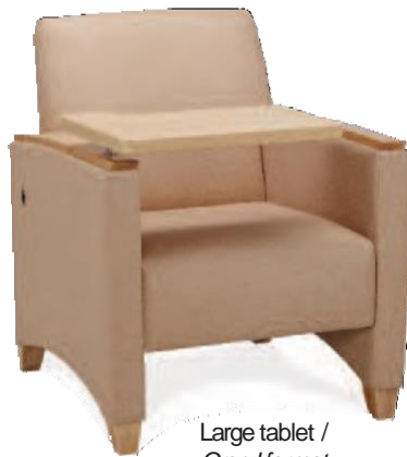
Large tablet / Grand format